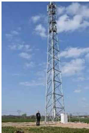
cette antenne le 27 mai 2024.

Les réseaux de téléphonie mobile font aujourd'hui partie intégrante de notre quotidien, ils sont en constante évolution pour répondre aux obligations réglementaires (couverture de 99.6 % de la population) et pour faire face aux besoins croissants de communication électronique .